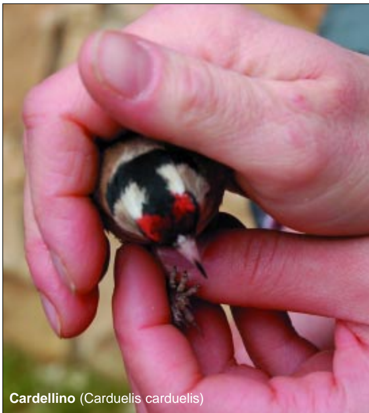
Cardellino ( Carduelis carduelis )

caccia a qualsiasi specie durante le fasi riproduttive e di migrazione di ritorno (primaverile), così come sono vietati i metodi di cattura non selettivi e di larga scala inclusi quelli elencati nell'allegato IV ( trappole, reti, vischio , utilizzato per la cattura dei pettirossi, fucili a ripetizione con più di tre colpi, caccia da veicoli, ecc ).