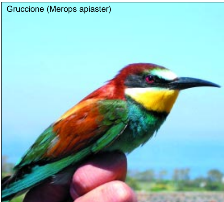
Gruccione (Merops apiaster)

Nel Centro non potranno essere accolti animali ritenuti dalla legislazione NON SELVATICI, tra questi i colombi peraltro potenziali vettori di malattie per gli altri volatili lì ospitati.