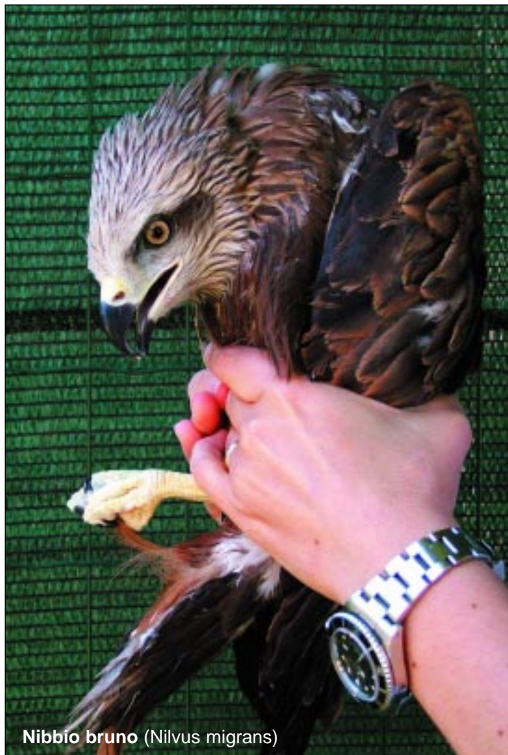
Nibbio bruno ( Nilvus migrans )