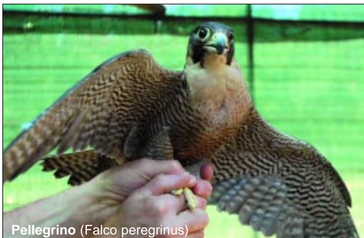
Pellegrino (Falco peregrinus)

La missione dei volontari LIPU è di conservare la natura partendo proprio dalla protezione degli uccelli e dei loro habitat, educare i giovani al rispetto del mondo in cui viviamo, sensibilizzare l'opinione pubblica su temi importanti come la tutela dell'ambiente e l'attenzione alla salute, questi sono i principali obiettivi definiti dallo Statuto dell'associazione. Motivo per cui il Centro Recupero per la Fauna Selvatica di Enna opera anche nel campo dell'educazione ambientale indirizzata soprattutto alle nuove generazioni con l'obiettivo di stimolare in loro sensibilità nei confronti di esseri affascinanti e degni di rispetto quali i selvatici. Per questa ragione il Centro è dotato di un'aula e di voliere didattiche dove i volatili irrecuperabili possono, con le dovute cautele, essere osservati dai visitatori.