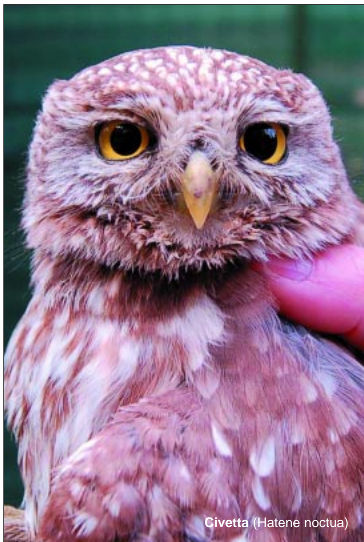
Civetta (Hatene noctua)