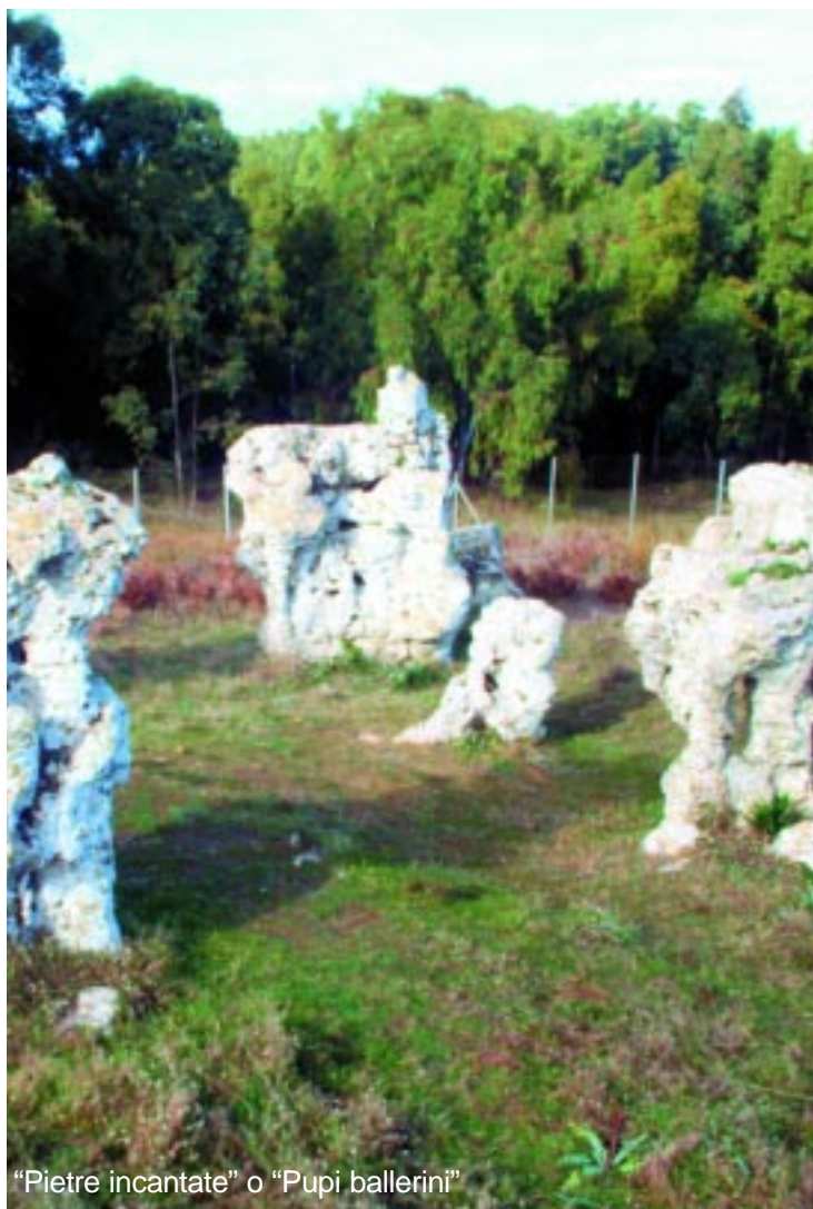
"Pietre incantate" o "Pupi ballerini"