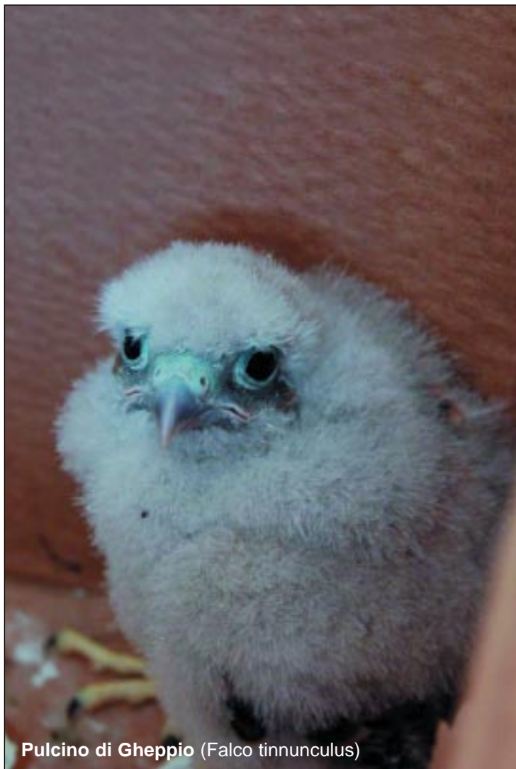
Pulcino di Gheppio (Falco tinnunculus)