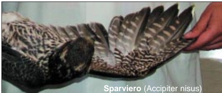
Sparviero (Accipiter nisus)

Rivolgetevi ad una delle seguenti strutture: