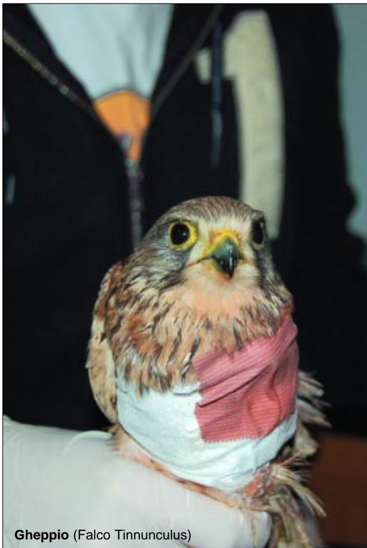
Gheppio (Falco Tinnunculus)